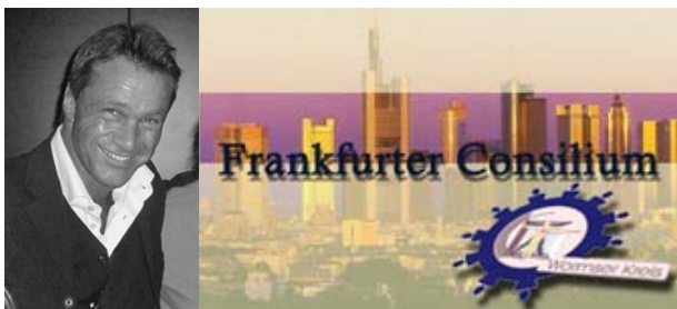
Ihr Ralf Kollinger

Raumakustik vorhanden, sowie Leinwand und Sitzplätze für wenigstens 90 Personen - Top Preisniveau und Top-Freundliches Personal. Parkplatzangebot in der Wiesbadener Straße auf dem Parkplatz der Fa. Transcar ab 18:00 Uhr, nur ein paar Schritte vom Hochheimer Hof entfernt .