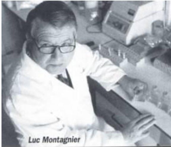
"Montagnier obtained his EMs from cultures done with umbilical cord blood lymphocytes."