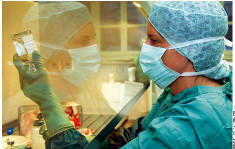
Forschung mit Zytostatika: „Es gab und gibt keine Erfolge“

Jedes Quartal verschreibt Overkamp seinen 1100 Krebspatienten Medikamente im Wert von etwa 1,5 Millionen Euro. Bundesweit summierte sich der Umsatz der Zytostatika zwischen August 2003 und Juli