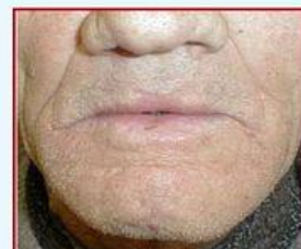
6 months after PDT therapy