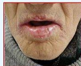
Before PDT therapy