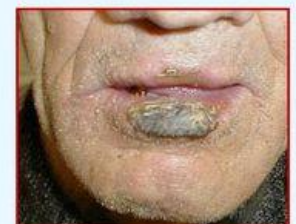
1 month after PDT therapy