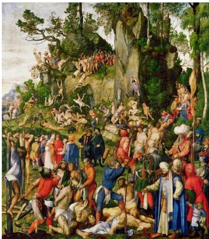
Abb. 2 Dürer, Das Martyrium der Zehntausend

Der ganz normale Massenmord unserer Tage, oder Die Banalität des Bösen. 4