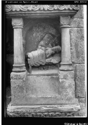
Abb. 3 Das Werk der Barmherzigkeit: Kranke pflegen Gallusporte am Basler Münster (Nordportal des Querschiffes)

In der Rhetorik der Täter spielt der Begriff „Wissenschaft“ eine wichtige Rolle. Oft genug wird er mit „Studie“ gleichgestellt. Darum seien diese Schlagworte einmal einer näheren Untersuchung unterzogen, um ihre „Tauglichkeit“, d.h. ihre Güte ( ἀγαθόν , agathón ) im Bereich Humanmedizin zu überprüfen, einem Lebensbereich, den wir seit alters den Werken der Barmherzigkeit und damit der „tätigen Liebe“ zuordnen.