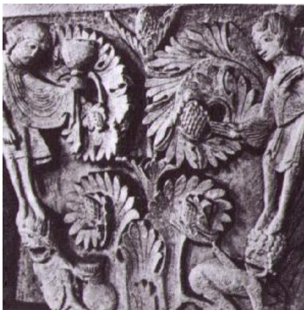
Abb. 4 Spes und Desperatio Caritas mit Kelch über Avaritia und Spes über Desperatio Kapitell von St. Lazare Autun 12.Jhd.

Da es bei einer tödlichen Erkrankung keine “Neutralität” zwischen “Hoffnung” und “Verzweiflung”, spes und de-speratio gibt, wird der Patient de facto in die Verzweiflung getrieben.